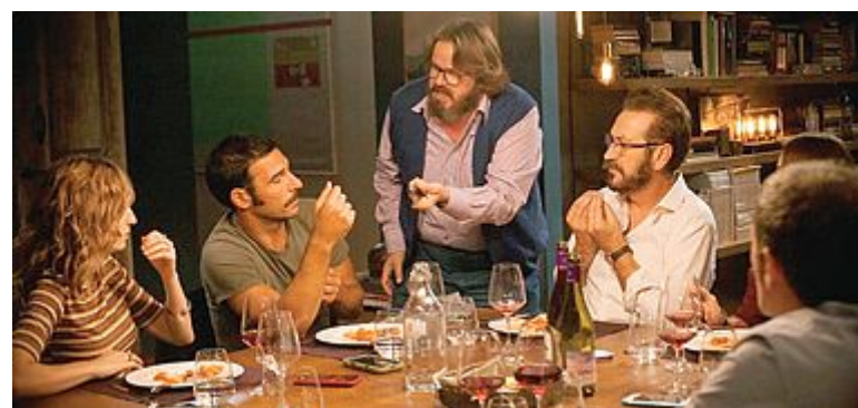
Una scena del film in programma stasera in via Sigonio

UNA CENA tra amici si trasforma in un gioco al massacro quando decidono di condividere i 'segreti' dei propri smartphone. Al SuperCinema Estivo di Modena, stasera alle 21.15, arriva 'Perfetti sconosciuti' di Paolo Genovese, che grazie ad un cast stellare e corale, tra gli altri ci sono Valerio Mastandrea, Giuseppe Battiston, Kasia Smutniak e Alba Rohrwacher, riesce a mettere in scena qualcosa in cui tutti si possono riconoscere e a raccontare così un